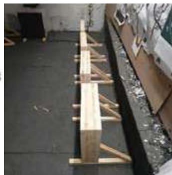
1. attēls. Attēlos redzams viens no izmantotajiem ieročiem GLOCK 5,56x43 un CLT dažādu slāņu paraugi