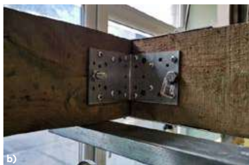
Fig. 1. Timber beams a) and its joint b).