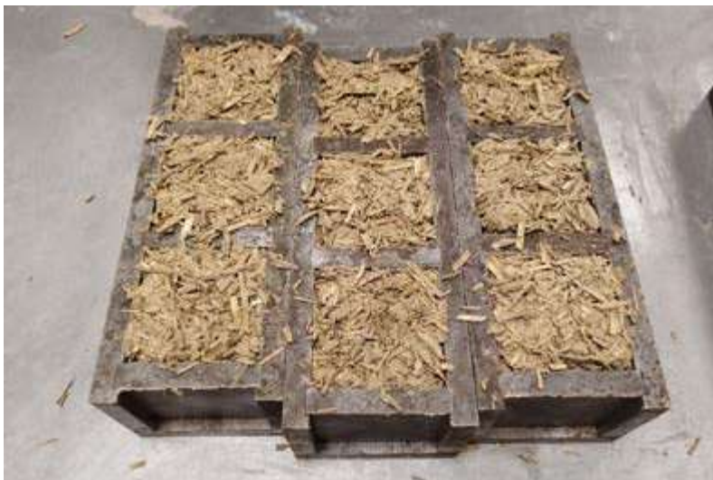
1. attēls. Biokompozītu izgatavošana tērauda veidņos.

Pētījuma pirmajā daļā tika sagatavoti vairāki saistvielu maisījumi. Tika izmantotas trīs MOC piedevas: vieglie pelni (FL) un divu veidu koloidālās silīcija dioksīda dispersijas (nanosilika). Katrai saistvielas pastai tika pārbaudīta iestrādājamība un saistišanās laiks. Lai noteiktu saistvielas spiedes stiprību, tika izgatavoti paraugi ar izmēriem 20 mm × 20 mm × 20 mm. Daļa paraugu tika cietināta laboratorijas apstākļos un pēc 1, 7 un 28 dienām pārbaudīta sausā stāvoklī, citi paraugi tika iegremdēti ūdenī 7. cietēšanas dienā un