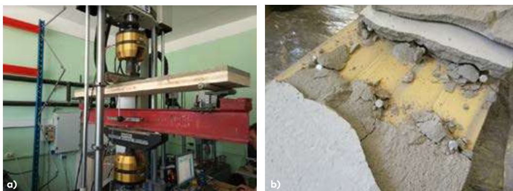
Fig. 1. Laboratory test of timber-concrete composite panels: a) placement of the timber-concrete composite panels in the testing machine; b) failure mode of the timber-concrete composite panels.

Behaviour of the timber-concrete composite panels with the semi-rigid timber to concrete